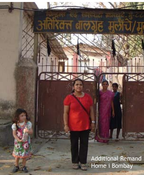
Additional Remand Home in Bombay